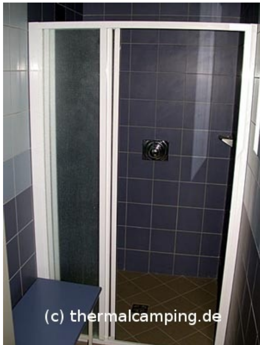
Dusche mit Vorraum